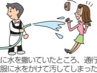
店先で水を撒いていたところ、通行人の衣服に水をかけて汚してしまった。