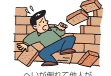
へいが倒れて他人がケガをした