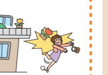
ベランダから植木鉢が落ちて他人にケガをさせた