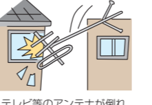
テレビ等のアンテナが倒れて隣家の窓ガラスが割れた