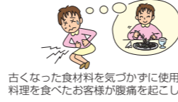
古くなった食料を気づかずに使用し、料理を食べたお客様が腹痛を起こした。