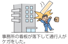
事務所の看板が落下して通行人がケガをした。