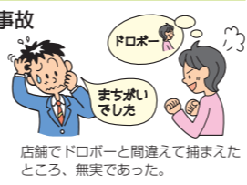
店舗でドロボーと間違えて捕まえたところ、無実であった。