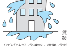
賃借している店舗で給排水管が破裂し、建物が水浸しとなった。 (注)①火災、②破裂・爆発、③給排水設備の事故による水濡れにより、賃借施設に損害を与えた場合に対象となります。