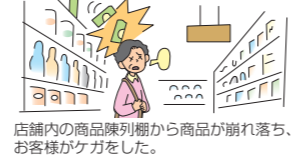
店舗内の商品陳列棚から商品が崩れ落ち、お客様がケガをした。