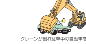
クレーンが倒れ駐車中の自動車を壊した