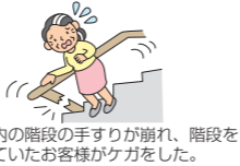
店舗内の階段の手すりから崩れ、階段を降りていたお客様がケガをした。