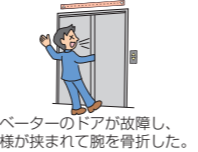
エレベーターのドアが故障し、お客様が挟まれて腕を骨折した。