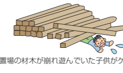
資材置場の材木が崩れ遊んでいた子供がケガをした