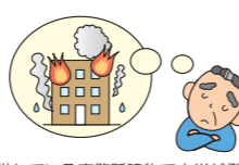
賃借している事務所建物で火災が発生し、建物を全焼させた。