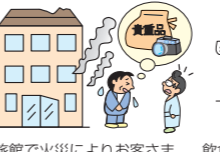
旅館で火災によりお客さまから預かった物を焼失してしまった