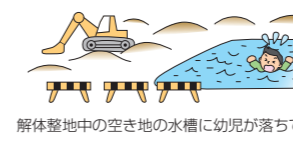
解体整地中の空き地の水溝に幼児が落ちて死亡した