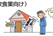
店舗で出した料理が原因で食中毒が発生し、20日間の営業停止となり、営業収益が減少した。