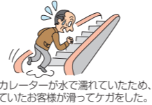
エスカレーターが水で濡れていたため、乗っていたお客様が滑ってケガをした。