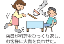
店員が料理をひっくり返し、お客様に火傷を負わせた。