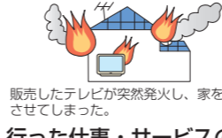
販売したテレビが突然発火し、家を全焼させてしまった。