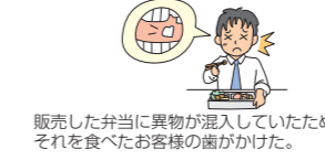
販売した弁当に異物が混入していたため、それを食べたお客様の歯が割けた。