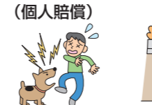
飼犬が他人にかみついた