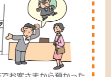
飲食店でお客さまから預かったコートが盗難にあった