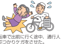
自転車で出前に行く途中、通行人にぶつかりケガをさせた。